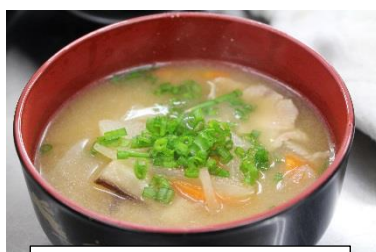
畑の野菜を使った豚汁