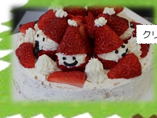
クリスマスケーキを作りました♪