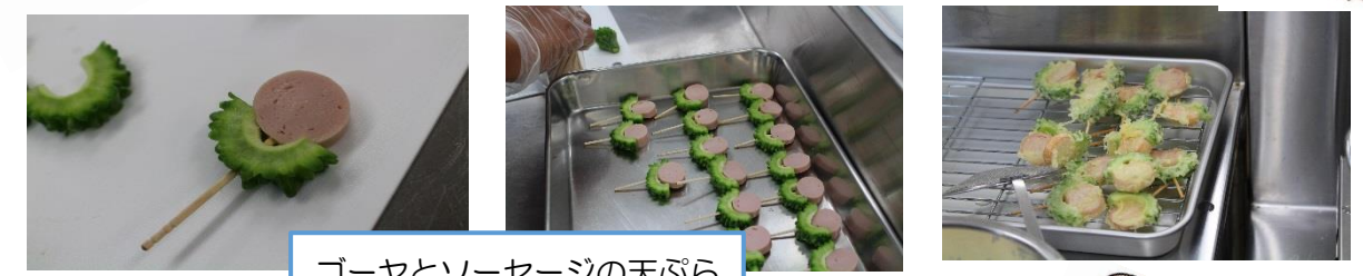
ゴーヤとソーセージの天ぷら