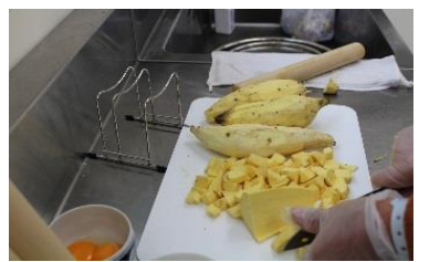
さつまいもティラミス

9月の誕生日の方、おめでとう ございます!!大量のティラミスが できあがりしましたね。